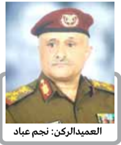
العميد الركن: نجم عباد

أقامت ألوية قوات الاحتياط للمنطقة العسكرية السادسة حفلاً خطابياً وعرضاً عسكرياً لوحدات رمزية من منتسبيها تحت شعار "لينصرن الله من ينصره إن الله لقوي عزيز".