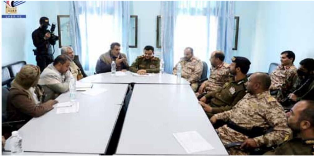
السلطة المحلية بما يمكنها من القيام بمهامها في خدمة أبناء المحافظة. وأكد على ضرورة اضطلاع الجميع بالمسؤولية لإحداث نقلة في مسارات العمل التنموي، وتلبية احتياجات المواطنين من