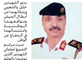
شيع يصنعاء جثمان فقيد الوطن والقوات المسلحة مدير الكلية البحرية الأسبق اللواء بحري ركن عبد الوهاب العلفي الذي وافاه الأجل بعد حياة حافلة بالعطاء في خدمة الوطن والقوات المسلحة. وفي مراسم التشييع التي شارك فيها مفتي الديار اليمنية العلامة شمس الدين شرف الدين وقائد القوات البحرية اللواء الركن محمد فضل وكبير المعلمين بالكلية البحرية العميد الركن عبدالله الشيبيني ومدير دائرة تقييم القوى البشرية العميد الركن عبدالعزيز صلاح وضباط وأهالي وأقارب الفقد، أشاد المشيعون بمناقب الفقد ودوره في تخريج الكوادر العسكرية من الكلية البحرية إلى جانب مواقفه الوطنية في مختلف مواقع وميادين القوات المسلحة.