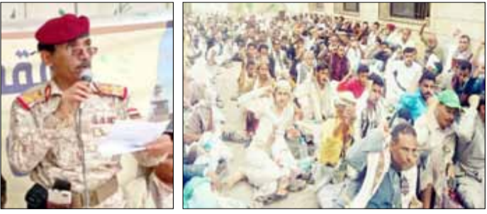
حجة - خاص:

في لقاءه بالمجاهدين والوجهات الاجتماعية بأفح اليمن محافظة حجة : لنفضد الفرقة والخلاف وتكون بمستوى الرهان لتعزيز الجبهة الداخلية