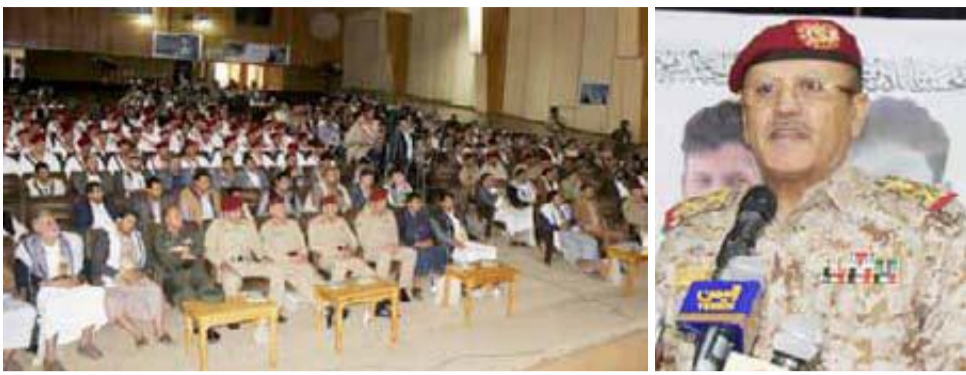
بعض مسؤولي وزارة الدفاع للموارد البشرية