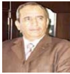
القاضي حسن الرصابي

بالزراعة والصناعة والبحث العلمي والأسماك، لذلك فإن ما يقوم به هذا القائد العسكري والقاضي والإعلامي والكاتب حسن الرصابي هو جهاد مشهود له ومقارعة مؤكدة ضد أعداء الأمة وضد صهيانية القرن من أعراب أحلاف منبطين ومزبتهين للأعداء ومن أشباه العلماء الذين لم يحترموا مساهمهم.. ولم يراعوا القيمة الدينية التي تصدروا لها وانساقوا إلى حملة تبعتها فاسترخصوا الثمن وذهبوا عنوة نحو الارتزاق القبيح التي لا تضع اعتبارا للمسؤولية الأخلاقية المدنية التي كان يتوجب عليهم احترامها ولكنهم انساقوا وتماهوا مع الأهداف واللقاصد السيئة العدوانية لقوى الصهيونية التكاليبة التي تسعى بكل ما أوتيت من دسائس ومؤامرات ومن مخططات عدائية جهنمية لإيجاد موطئ قدم لها في اليمن ووجدت في مثل هذه القوى الانبساطية الرخيصة رهاتها ورأت فيها وسيلتها للتغوية للوصول إلى أهداف مريبة وعدائية في هذا الإطار القاصف والقيادي العسكري حسن الرصابي وفي عمل طوعي قدم من خلال إسهاماته الكتابية وفي المقدمة كتابه "الرسالة الوطنية" "حاجج" فيه للارتزاق وفند ادعاءات علماء الغفلة الذين انصاعوا لإصداق فتاوى مدهانة أو في إطلاق التصريحات الإعلامية التسويقية التي تسوغ وتشجع للاحتلال والغزو الأجنبي وانتهاك السيادة الوطنية والرضوخ لاصلاوات أولئك الغزاة والطامعين..